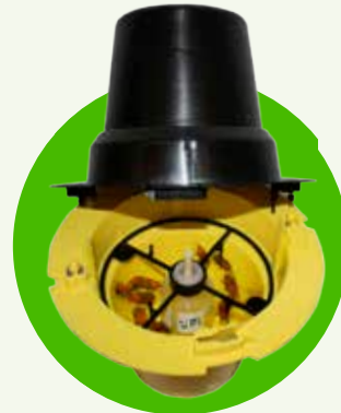
Pitfall trap, περιέχει τη φερομόνη Rhyncho Pro Classic